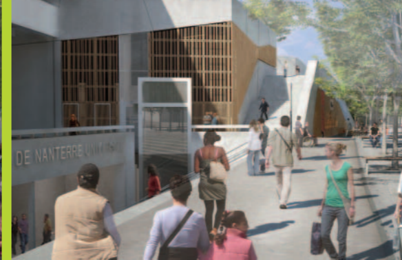
Le cours de l'Université