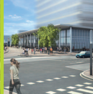
Vue depuis la future place des Provinces Françaises

Le chantier de la gare Nanterre-Université en chiffres