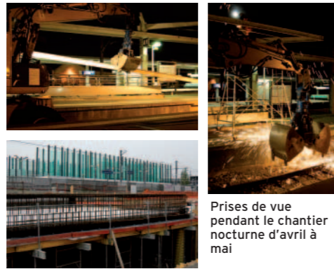
Prises de vue pendant le chantier nocturne d'avril à mai

Couvrant les quais au-dessus du souterrain actuel, la nouvelle gare sera construite à 150 mètres à l'ouest de l'ancienne, qui sera démolie à la fin des travaux. Largement vitrée, pratique et confortable, elle est bâtie sur 3 étages reliés par des escaliers mécaniques et des ascenseurs.