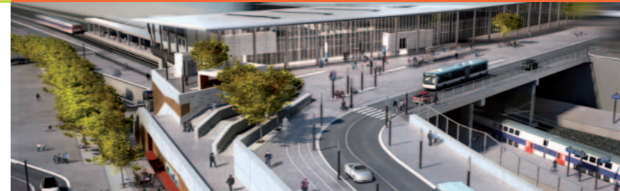
Vue aérienne du parvis

LA CONSTRUCTION DE LA NOUVELLE GARE A COMMENCÉ. LE CHANTIER VA DEVENIR VISIBLE. EN 2014, UNE NOUVELLE GARE MULTIMODALE OUVRIRA SES PORTES À NANTERRE, PLUS CONFORTABLE ET ACCESSIBLE À TOUS. DE NOUVELLES LIAISONS SERONT CRÉÉES DANS UN QUARTIER ENTIÈREMENT REPENSÉ.